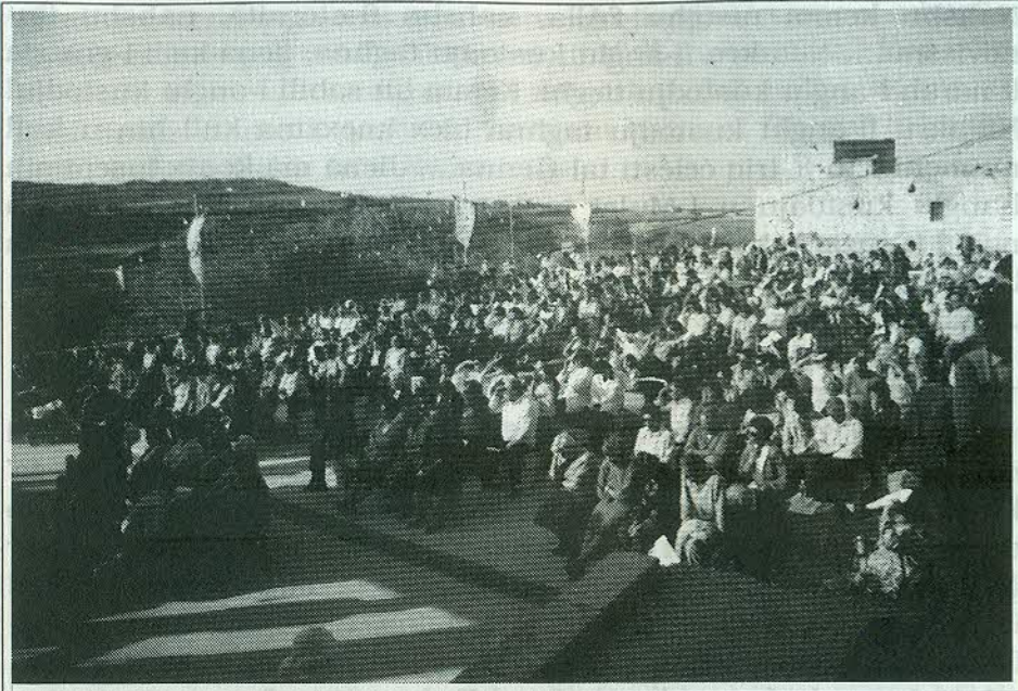
Il-folla li attendiet għall-pellegrinaġġ tal-5 ta' Mejjun 1996

tagħha (li siltiet minnu jidhru ffuljett ieħor).